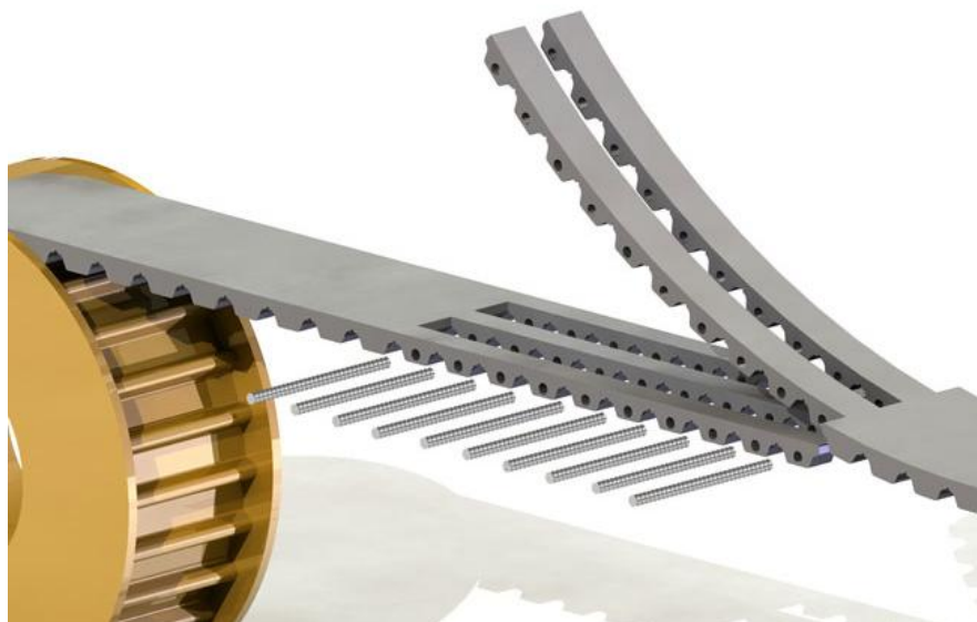
Mechanische Zahnriemenverbindung „Pin Join“